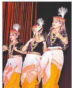
सुभारती में कार्यक्रम की प्रस्तुति देती छात्राएं।