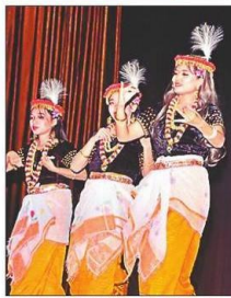
सुभारती में कार्यक्रम की प्रस्तुति देती छात्राएं।