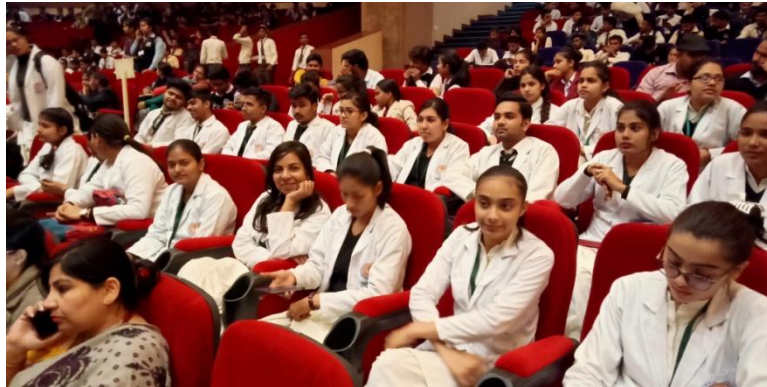
“National Seminar on Spirituality & Mental well being a new Era”