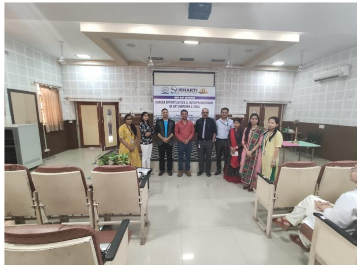
Our college organized a “One day Seminar on Career Opportunities and Entrepreneurs dated on 9 th October 2019