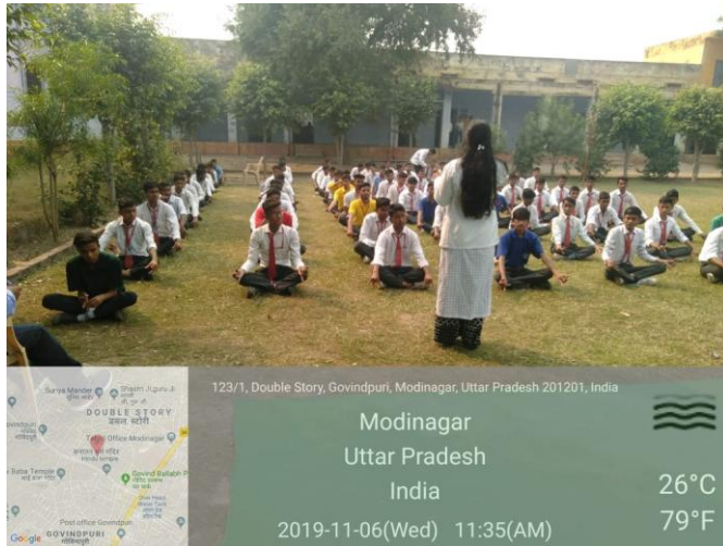
Our college Intern & students dated on 6 th November, 2019.