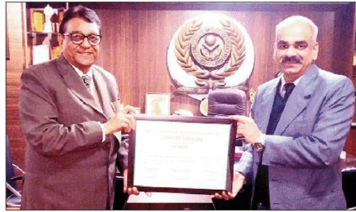
सम्मान प्रतीक के साथ सुभारती विवि के कुलपति।