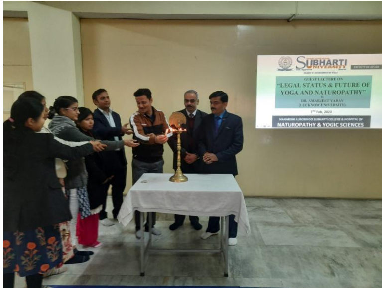
Lighting of the lamp Legal Status & Future of Yoga and Naturopathy