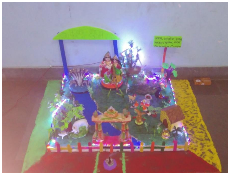
Janmashtami' on 23 rd August 2019