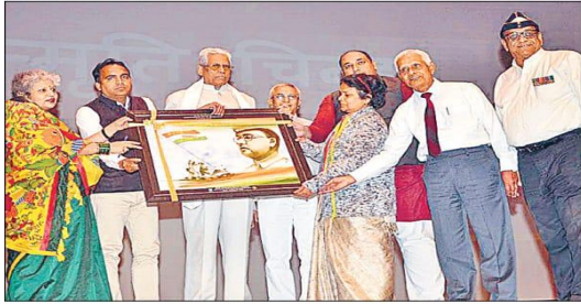
सुभारती विवि में अखंड भारत की वर्षगांठ पर अतिथियों को सम्मानित किया गया।