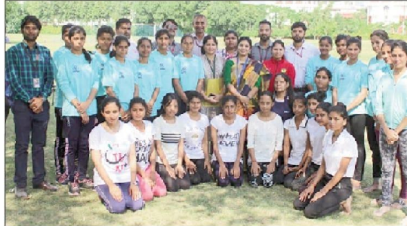
सुभारती विवि में आयोजित खेल प्रतियोगिताओं के विजेता छात्र-छात्राएं।