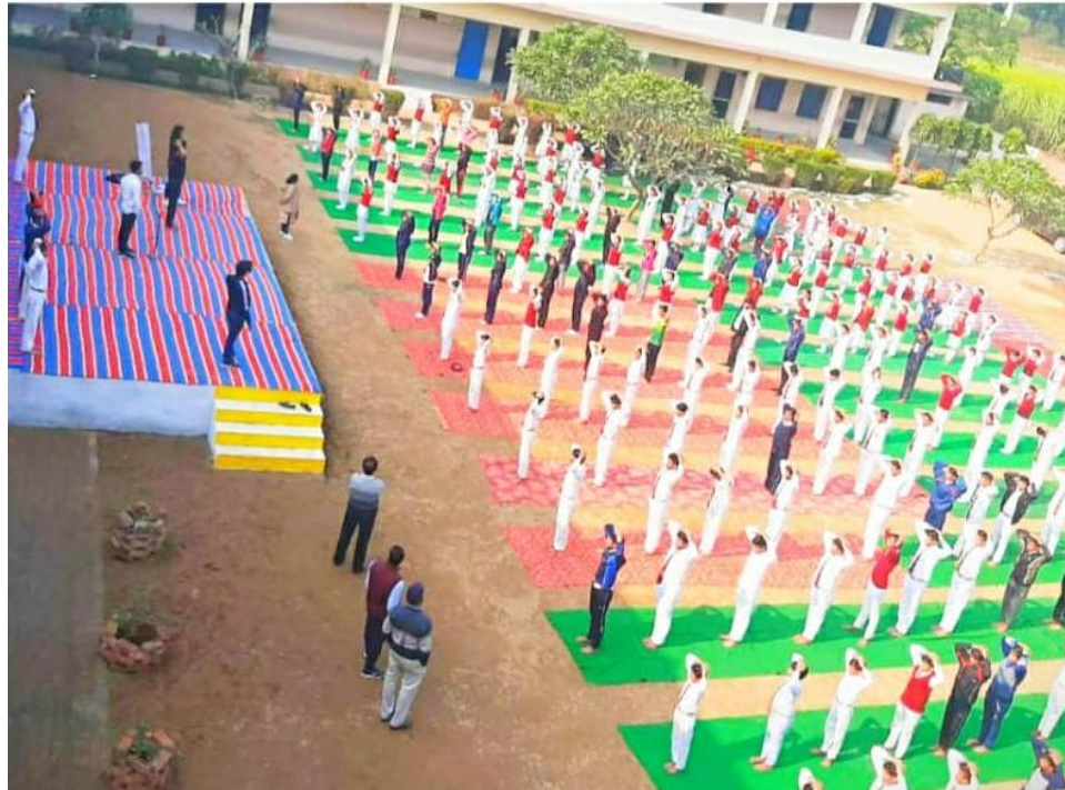
Our college Student Abhishek Rathour, Suchi, Abhishek Singh BNYS 2015 batch, conducted a “Yoga Workshop” dated on 7 th December, 2019