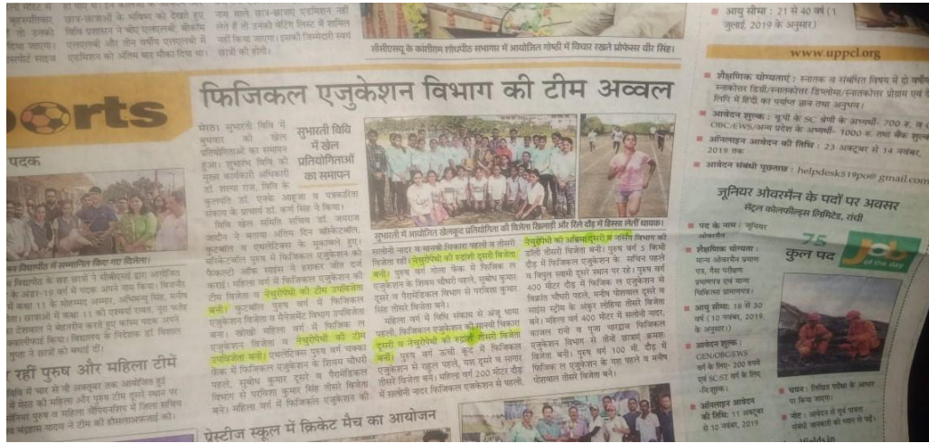
Article of Three days sports competition at SVSU Meerut.