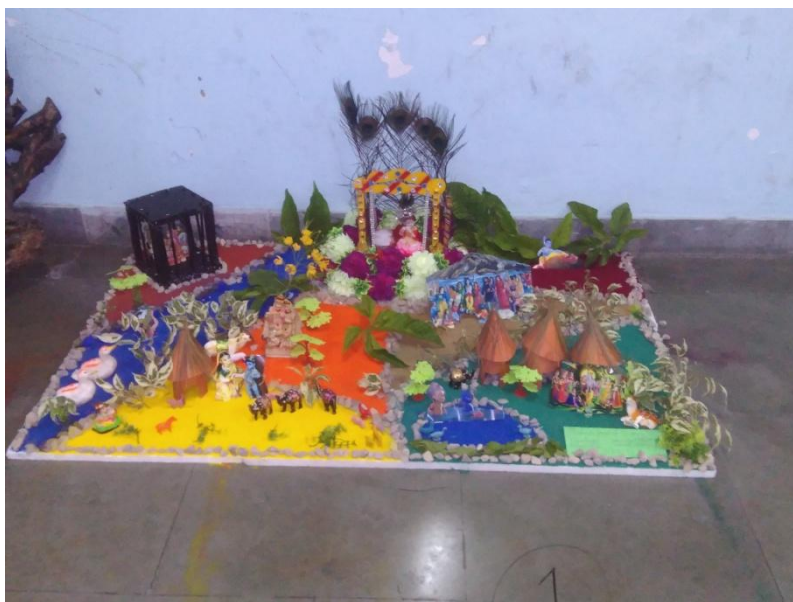
Janmashtami' on 23 rd August 2019