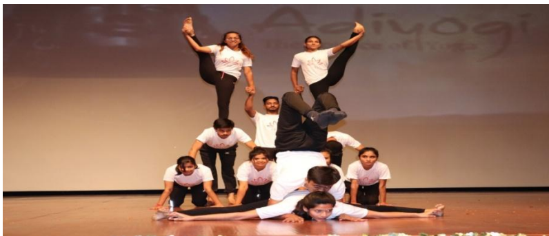
Our Faculty and students attended the Teacher's Day Programme on 05 th September 2019