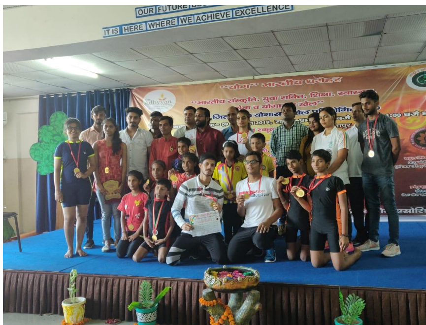
Bnys Students dated on 9 th August 2019.