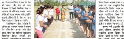
खेल प्रतियोगिता के दौरान खेल रहे हुए सुभारती विश्वविद्यालय के खिलाड़ियों का दृश्य।