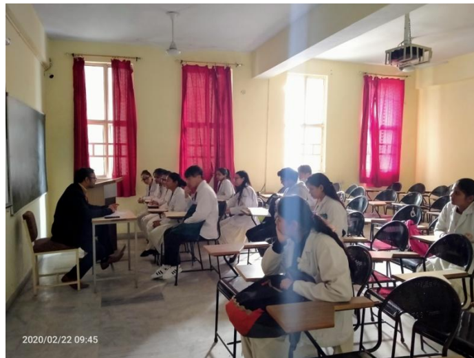
Mentor with their respective students