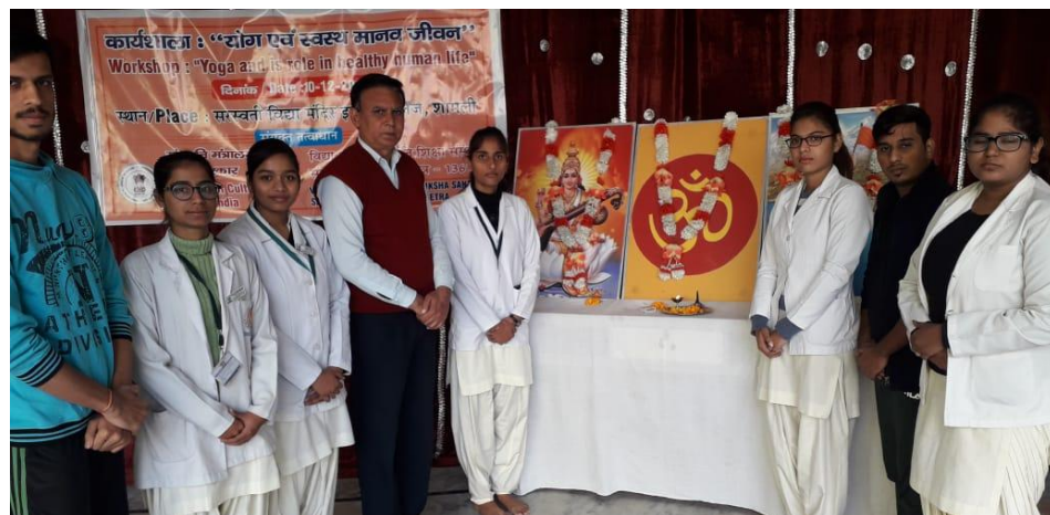
Our college Student conducted a “Yoga Workshop” dated on 10 th December, 2019.