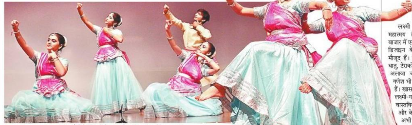
सुभारती विवि में आयोजित कार्यक्रम में नृत्य करते कलाकर।