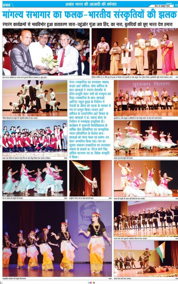
Article of 76 Anniversary dated on 21 st October 2019 at SVSU Meerut.