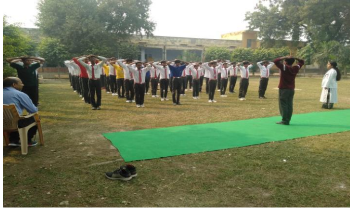
Our college Intern & students dated on 6 th November, 2019.