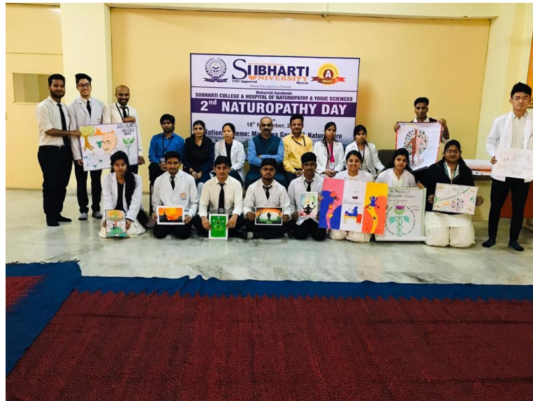
All faculty & all student Naturopathy day has celebrated from 18 th November 2019.