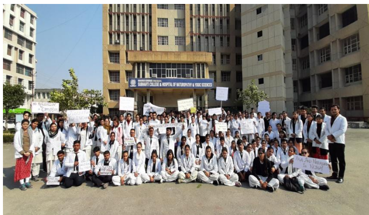
Students in silent protest outside the College