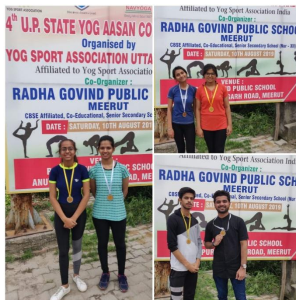
Bnys Students dated on 9 th August 2019.