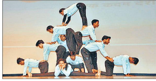
सोमवार को सुभारती विवि में छात्रों ने रंगारंग कार्यक्रम पेश किए। • हिन्दुस्तान