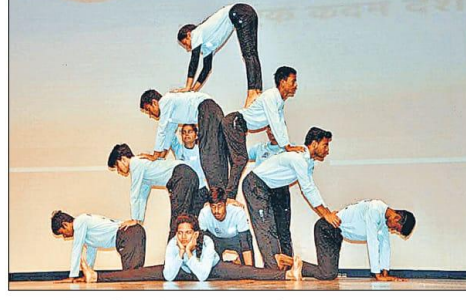
सोमवार को सुभारती विवि में छात्रों ने रंगारंग कार्यक्रम पेश किए। • हिन्दुस्तान