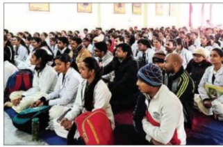
कार्यशाला में उपस्थित छात्र-छात्राएं।