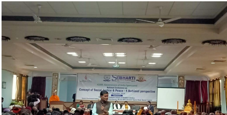
Our Faculty Attended National Conference Regarding “Concept of Social Justice, & Peace” A Buddhist Perspective dated on 5 th December 2019