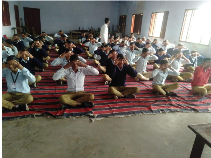
Our college Intern & Students Conducted workshop dated on 2 nd December 2019.