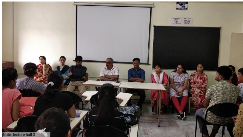
All faculty and Students interaction dated on 10 th August 2019.