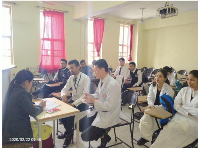
Mentor with their respective students