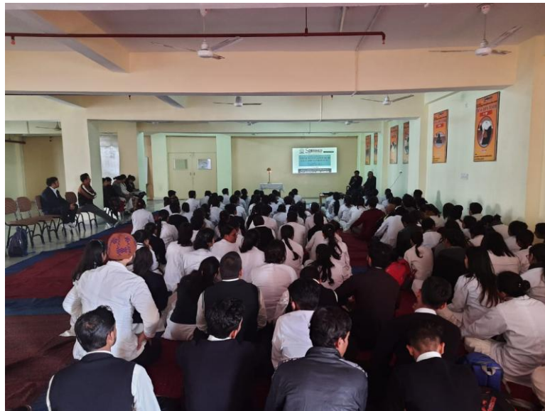
Legal Status & Future of Yoga and Naturopathy