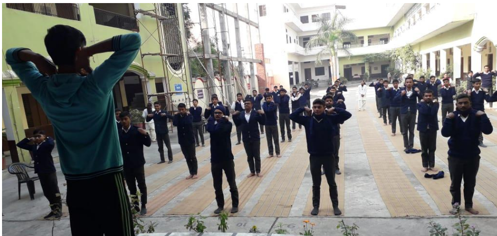
Our college Student conducted a “Yoga Workshop” dated on 10 th December, 2019.