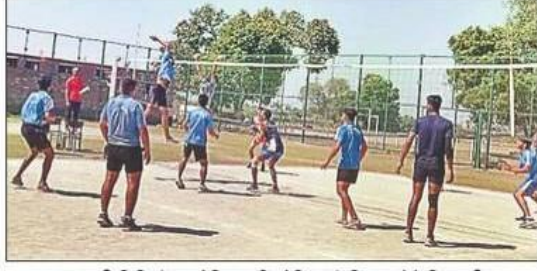
सुभारती विवि में आयोजित प्रतियोगिता में हिस्सा लेते खिलाड़ी।