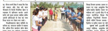
खेल प्रतियोगिता के दौरान खेल रहे हुए सुभारती विश्वविद्यालय के खिलाड़ियों का दृश्य।