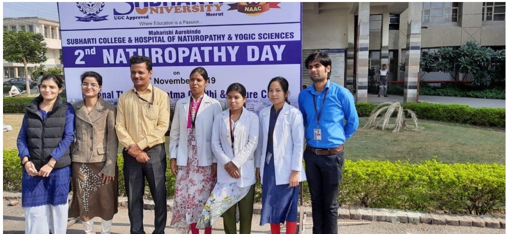
All faculty celebrated from 18 th November 2019.