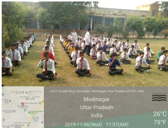
Our college Intern & students dated on 6 th November, 2019.