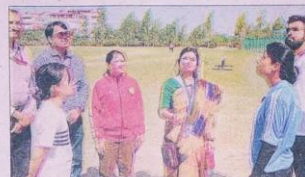
सुभारती विश्वविद्यालय में चल रही खेलकूद प्रतियोगिता का समापन हो गया।