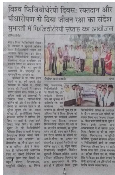
World Physiotherapy day dated on 08 th September 2019.