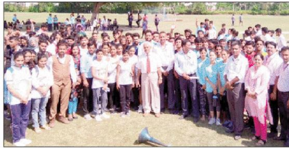
सुभारती विवि में खेल प्रतियोगिता के दौरान छात्र-छात्राएं व अतिथिगण।

उन्होंने बताया कि इस प्रकार की प्रतियोगिताओं का मुख्य उद्देश्य विद्यार्थियों के अन्दर छिपी प्रतिभाओं