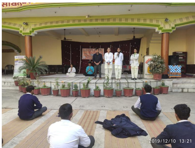
Our college Student conducted a “Yoga Workshop” dated on 10 th December, 2019.