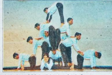
सोमवार को सुभारती विधि में छात्रों ने रंगारंग कार्यक्रम पेश किए। • विन्दुस्तन