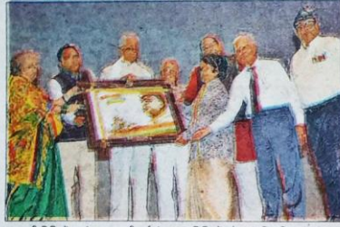
सुभारती विधि में अखंड भारत की वर्षगांठ पर अतिथियों को सम्मानित किया गया।