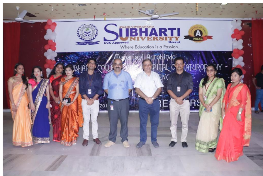
All faculty dated on 31 st August 2019.