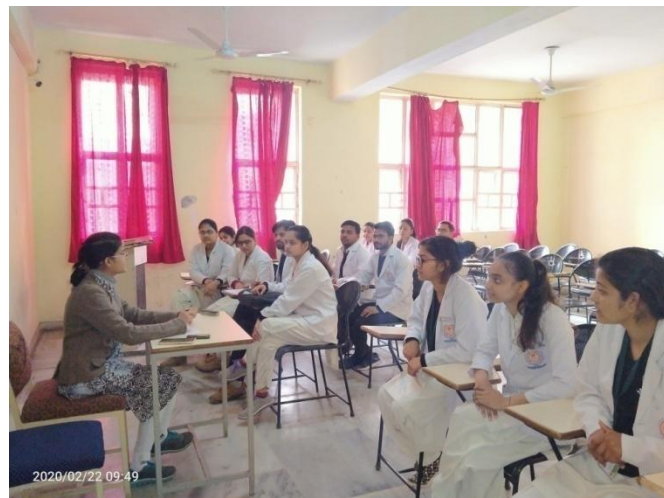
Mentor with their respective students