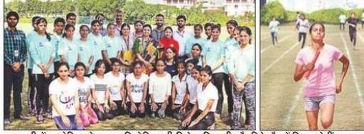
सुभारती में आयोजित खेलकूद प्रतियोगिता की विजेता खिलाड़ी और रिले दौड़ में हिस्सा लेती धावक।

सुभारती विवि में खेल प्रतियोगिताओं का समापन