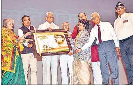
सुभारती विवि में अखंड भारत की वर्षगांठ पर अतिथियों को सम्मानित किया गया।

Article of 76 Anniversary dated on 21 st October 2019 at SVSU Meerut .