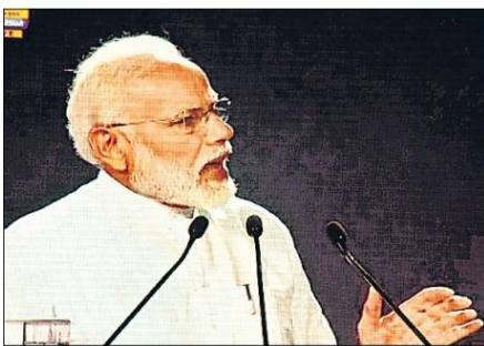
सुबह १०.३० बजे जैसे ही प्रधानमंत्री लाइव आए तो विवि का ऑडिटोरियम तालियों से गुंज उठा। इसके बाद प्रधानमंत्री ने फिट रहने के लिए प्रतिदिन किए जाने वाले छोटे-छोटे उपायों को बताया। ● हिन्दुस्तान

Participated in Fit India Movement dated on 29 th August 2019.