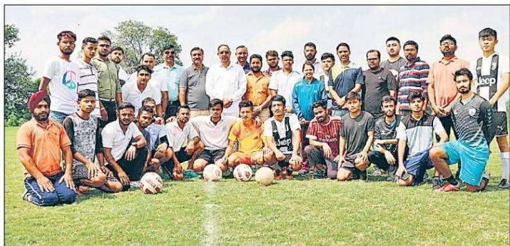
राष्ट्रीय खेल दिवस पर क्रीड़ा भारती की ओर से सुभारती विश्वविद्यालय में विभिन्न खेलों का आयोजन हुआ।

Participated in Fit India Movement dated on 29 th August 2019.