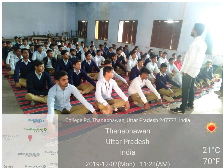
Our college Intern & Students Conducted workshop dated on 2 nd December 2019.