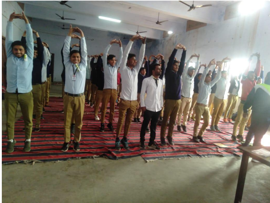
Our college Intern & Students Conducted workshop dated on 2 nd December 2019.