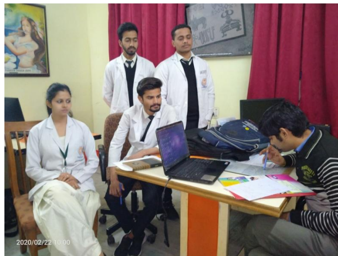
Mentor with their respective students