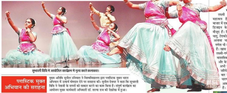
सुभारती विवि में आयोजित कार्यक्रम में नृत्य करते कलाकार।