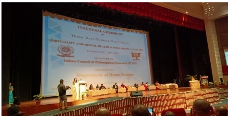
“National Seminar on Spirituality & Mental well being a new Era”