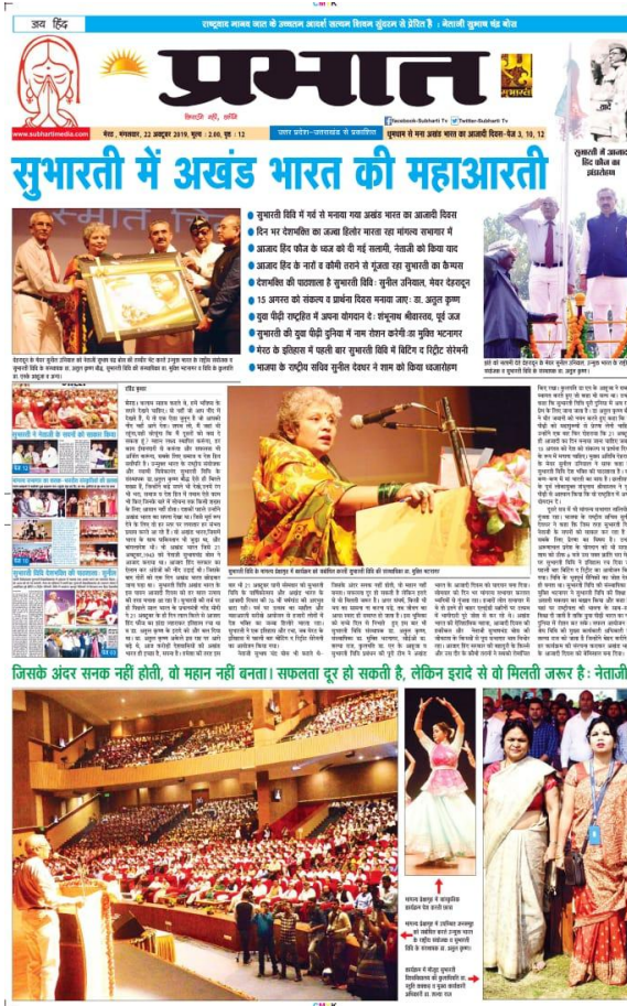
Article of 76 Anniversary dated on 21 st October 2019 at SVSU Meerut .