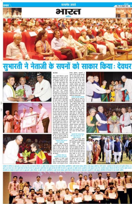
Article of 76 Anniversary dated on 21 st October 2019 at SVSU Meerut .